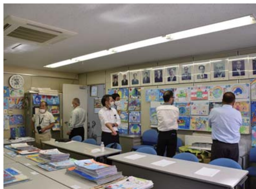
事務局での審査の様相

なお、入賞した33点の作品は例年通り県内の3会場で作品展示を行い、多くの方に子どもたちの素晴らしい作品を見ていただくことができました。