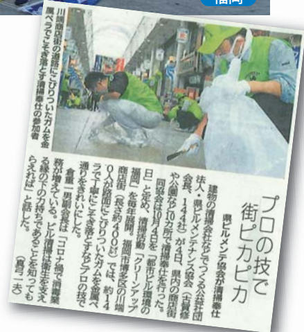
▲「クリーンアップ福岡」の活動を伝える西日本新聞（朝刊）10月12日（火）付の記事

次年度は、新型コロナウイルスの感染動向にもよりますが、コロナ前の活動以上の開催を企画したいと思っておりますので、引き続き皆様のご理解とご協力をよろしくお願いいたします。