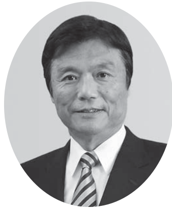
福岡県知事 小川 洋