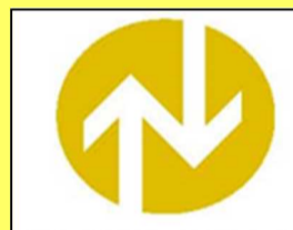
昇降機等 定期検査報告マーク