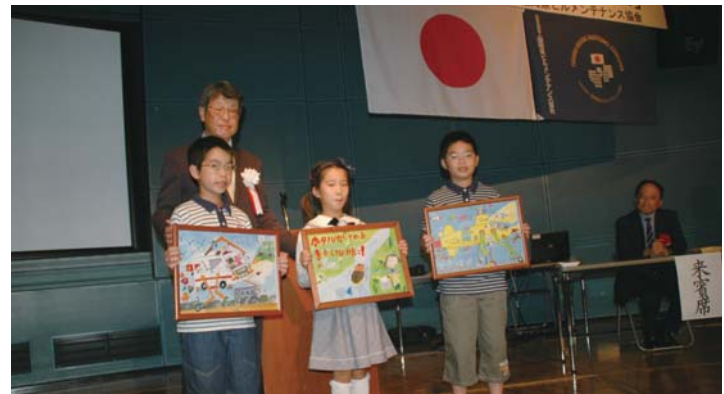
2013年度「最優秀賞受賞者」の表彰風景

作品展示期間 平成26年10月16日（木）～ 10月21日（火） 展示場所 久留米市役所2階