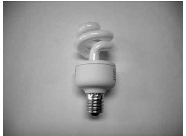
写真-2 電球形蛍光灯

実は写真-1の上二つが40W型蛍光灯で、一番下だけが60W型ミニクリプトン電球である。