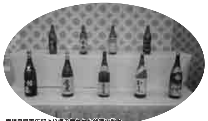
鹿児島県青年部より振る舞われた銘酒の数々

このような交流会を通し、将来へ向けて、同じ業界でバリバリと働く世代として強い絆をつくり、かつ良きライバルとして、より良い業界発展へ向け頑張っていくと誓うのであります。 (青年部拡大交流委員会)