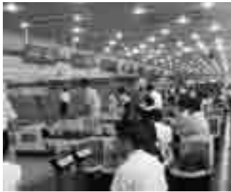
会場での熱戦の様相

日時 平成21年8月28日(金) 18:15~ 会場 博多スターレーン 参加者 22チーム 66名